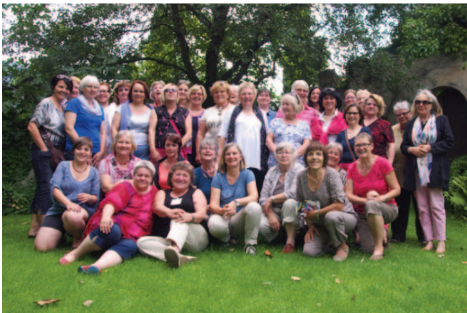
Participant·es au séminaire « L'Europe sociale en déclin ? Stratégies contre le chômage et la pauvreté » du KAB Deutschlands (Katholische Arbeitnehmer-Bewegung Deutschlands e.V. / Mouvement des travailleurs catholiques d'Allemagne) qui eut lieu en juin 2014 dans le cadre de la série de séminaires

Etant donné que l'emploi des jeunes en Europe est un thème urgent, important, mais également complexe, EZA a décidé de se fixer comme objectif ces projets relatifs à la stratégie Europe 2020 et d'en assurer l'accompagnement scientifique. L'Institut autrichien des hautes études (IHS) se charge de cet accompagnement par le biais de chercheurs scientifiques qui font une présentation sur le sujet dans le cadre de toute une série de séminaires et qui rassemblent ensuite les