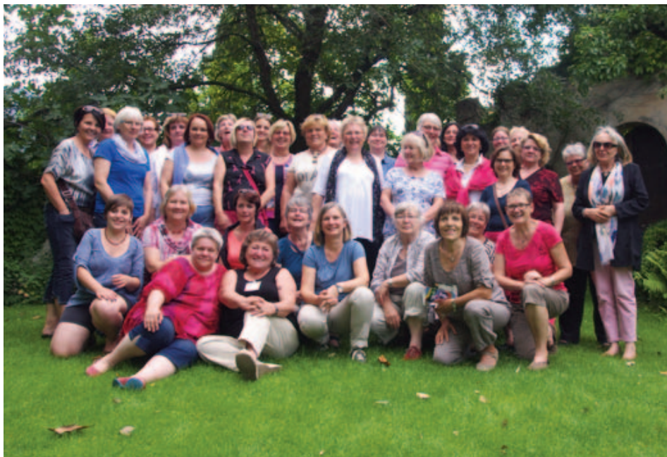
Participantes del seminario “¿Desaparición de la Europa social? Estrategias contra el paro y la pobreza” de KAB Alemania (Katholische Arbeitnehmer-Bewegung Deutschlands e.V.) en junio de 2014, uno de los seminarios celebrados

La presentación incluirá información completa sobre las estrategias europeas y nacionales para la lucha contra el desem-