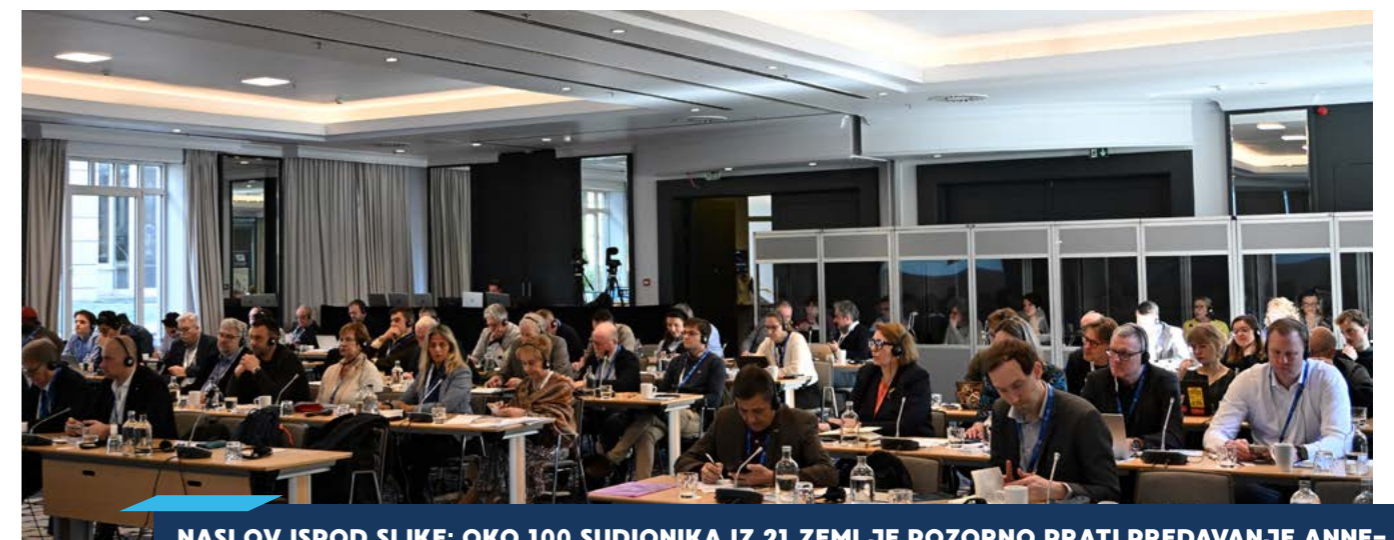
NASLOV ISPOD SLIKE: OKO 100 SUDIONIKA IZ 21 ZEMLJE POZORNO PRATI PREDAVANJE ANNE-CÉCILE ROBERT, ZAMJENICE GLAVNOG UREDNIKA ČASOPISA „LE MONDE DIPLOMATIQUE“

Drugo je pitanje u kojoj se mjeri izdatci za obranu pozitivno odražavaju na rast i zaposlenost. Ne treba nijekati da takvi učinci mogu postojati (osim ako se povećana sredstva većim dijelom troše na uvoz naoružanja).