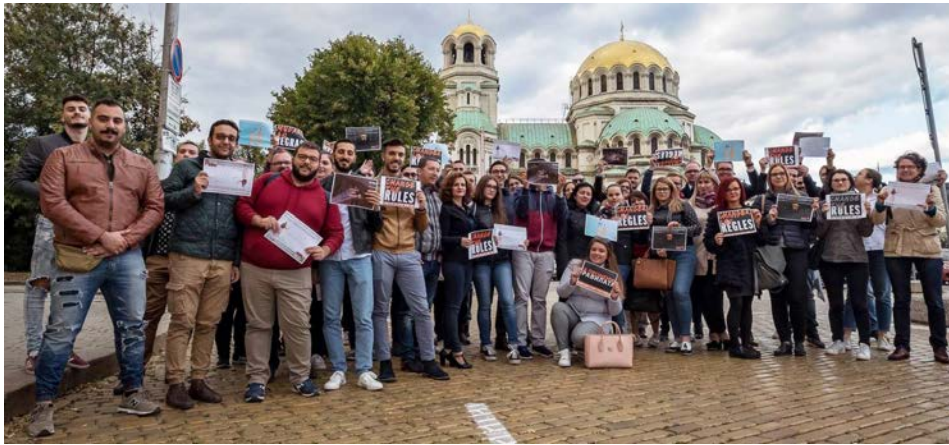
Sudionici i sudionice Konferencije za mlade u Sofiji, Bugarska, 2018. godine

imati za cilj: 1.) sindikalno organiziranje mladih i njihovo pridobivanje za ciljeve sindkata, 2.) dobru komunikaciju i 3.) osigurati zastupljenost mladih. Zastupljenost mladih znači organizirati mjesto okupljanja i tako omogućiti mladim sindikalcima da budu vidljivo prisutni na prvoj liniji fronte kako bi poticali aktivnosti i sudjelovali u procesu donošenja odluka. Tako bi mladi dobili šansu da preuzmu odgovornost. Denis Strieder, tajnik za mlade u FCG-u (Fracija kršćanskih sindikata u Austrijskom savezu sindikata) jedan je od takvih partnera za suradnju. On je zajedno sa Diomidesom Diomidousom (DEOK, član Upravnog vijeća EZA-e) izlagao na temu zastupljenosti mladih. Denis je istakao da bi njegova organizacija morala godišnje pridobiti 3.000 novih članova za održavanje sadašnjeg broja članova. Diomides je istakao da na Cipru ne postoje dugoročne strategije za obnavljanje baze članova.